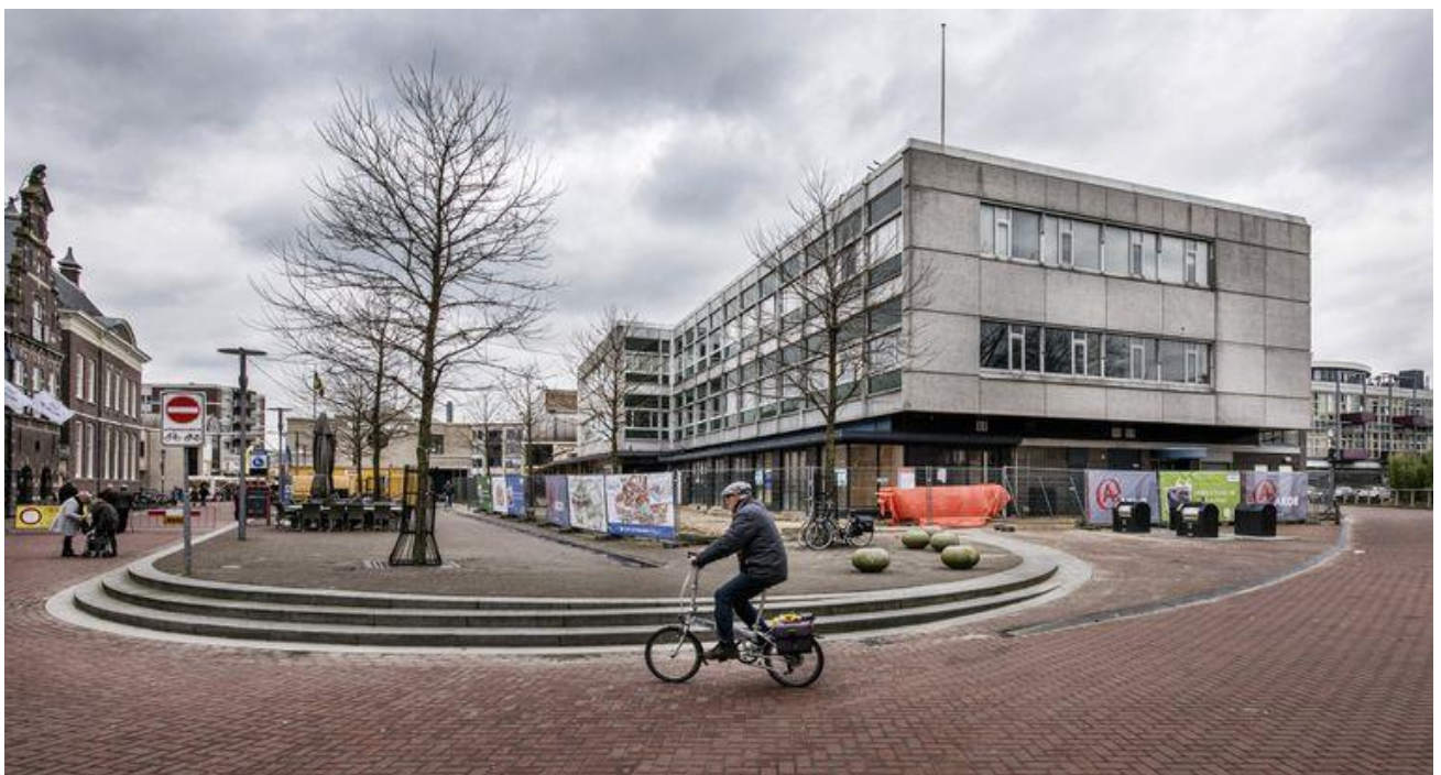
De lege V&D-kubus aan het doodse Centrumplein in Almelo.

Alleen, zo blijkt, kampen steden als Almelo met een structureel gebrek aan zelfstandigen die de huurprijzen van voor de crisis willen betalen, terwijl ze de klandizie van erna verwachten. Zo vestigde zich de afgelopen twaalf jaar nooit een ambachtelijk bakkertje in het voormalige V&D-pand aan het Centrumplein. Vastgoedeigenaar Urban Interest verhuurde kortstondig aan Big Bazaar, Bristol en Op=Op voordeelshop, er woonden wat antikrakers op de derde, maar dat was het ook wel.